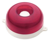
МАЯК-12-КП, МАЯК-24-КП оповещатель комбинированный