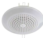
АРИЯ-10 П оповещатель речевой 3Вт/5Вт/10Вт